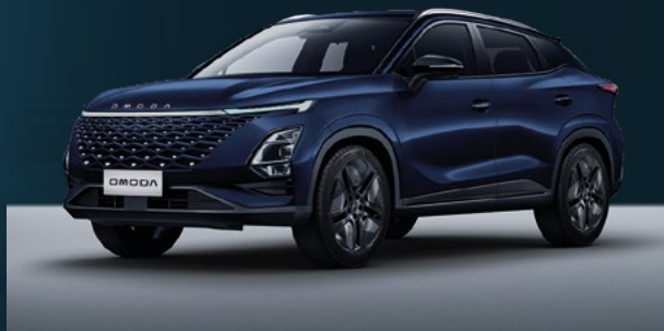
Midnight Blue Dla wersji Comfort i Premium