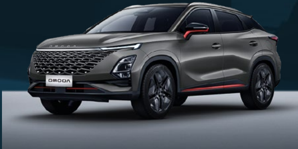
Phantom Gray z czerwonymi akcentami Dla wersji Premium