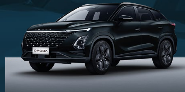
Carbon Black Dla wersji Comfort i Premium