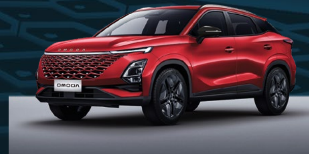
Blood Red Dla wersji Comfort i Premium