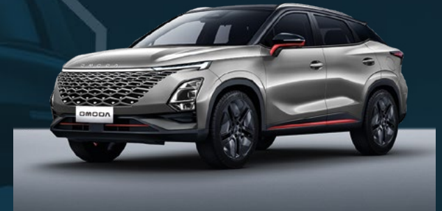
Aviation Silver z czerwonymi akcentami i czarnym dachem Dla wersji Premium