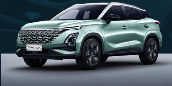
Aqua Green z białym dachem Dla wersji Premium

Czerwone elementy znajdują się na podstawach lusterek bocznych, dolnej kracie wlotu powietrza oraz na listwach bocznych drzwi