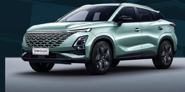
Aqua Green Dla wersji Comfort i Premium