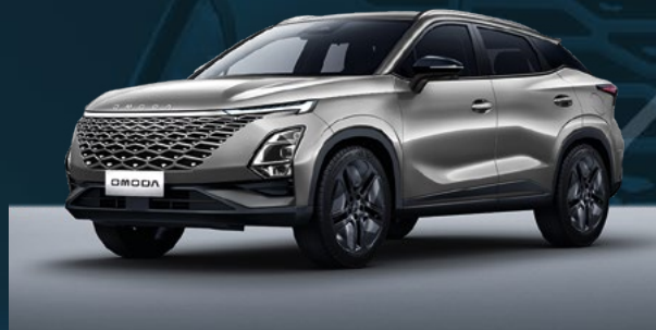
Aviation Silver Dla wersji Comfort

I co najważniejsze, niezależnie jaki kolor wybierzesz, nie dopłacasz za niego.