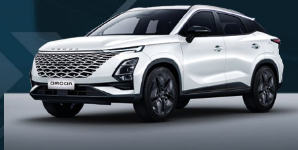
Khaki White Dla wersji Comfort