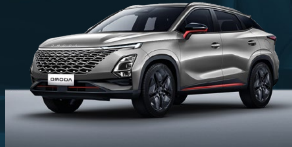
Aviation Silver z czerwonymi akcentami Dla wersji Premium