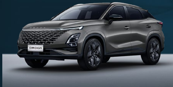
Phantom Gray Dla wersji Comfort