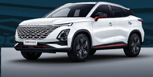
Khaki White z czerwonymi akcentami Dla wersji Premium