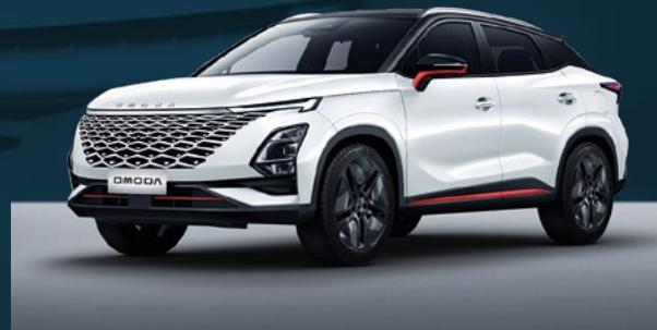
Khaki White z czerwonymi akcentami i czarnym dachem Dla wersji Premium